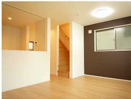
★A号棟リビング写真(平成29年11月撮影)