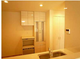
★D号棟キッチン収納写真(平成29年11月撮影)