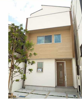
★A号棟外観写真(平成29年11月撮影)